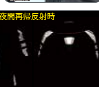
夜間再帰反射時 Front Back