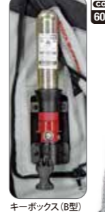
キーボックス (B型) カートリッジボンベ 60ccを装着したエアバッグ起動装置

アウター裏地に透湿防水素材INTERONを採用、防寒ライナー脱着式で3wayの着こなしが可能!