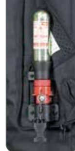
キーボックス (B型) カートリッジボンベ 50ccを装着したエアバッグ起動装置

スポーティなデザインにベンチレーションやリフレクターなど機能性を充実させたロングシーズン対応モデル。