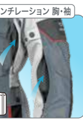
ベンチレーション 胸・袖