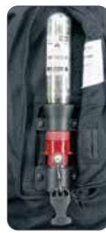
キーボックス (B型) カートリッジボンベ 60ccを装着したエアバッグ起動装置

hit-air エンデュロモデル! メッシュ素材とファスナーベンチレーションで空気循環を自由に調節、マルチで多彩な収納ポケットのエアバッグジャケット!