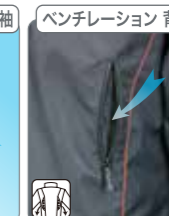
ベンチレーション 胸・袖