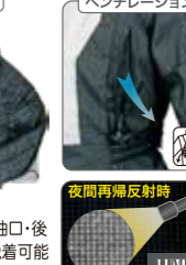
ベンチレーション