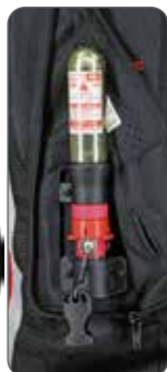
キーボックス (B型) カートリッジボンベ 50ccを装着したエアバッグ起動装置

通気性と強度を備えた密度の高いメッシュ素材と視認性を高めるリフレクター素材の「LUMIDEX」を採用!