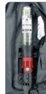
キーボックス (B型) カートリッジボンベ 60ccを装着したエアバッグ起動装置