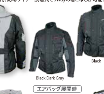
Black Dark Gray