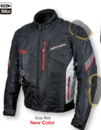
Gray Red New Color