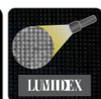
リフレクターが生地に織り込まれた機能素材

安全への配慮から各所にリフレクターやLUMIDEXの反射素材を配置し、夜間等の視認性を高めます。